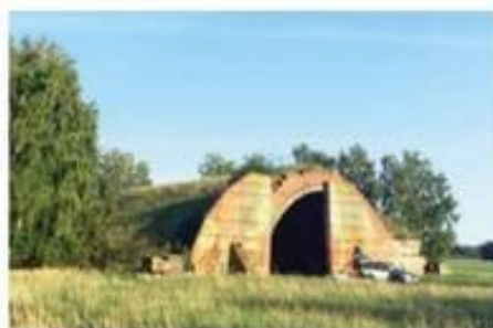
Bunkerne i Neuruppin husede engang kampklare sovjetiske MIG-jagere