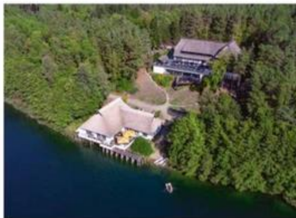
Tidligere DDR-generalsekretær Erich Honeckers jagtresidens er nu hotel og restaurant