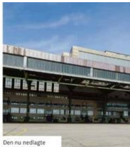
Den nu nedlagte lufthavn uden for Berlin var alle lufthavnes moder, da den blev opført i starten af 1920'erne