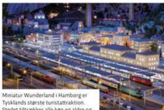
Miniatur Wunderland i Hamborg er Tysklands største turistattraktion. Stedet tiltrækker alle køn og aldre og modeljernbanen fornyes løbende