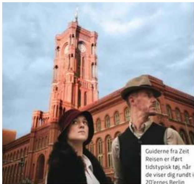
Guiderne fra Zeit Reisen er iført tidstypisk tøj, når de viser dig rundt i 20'ernes Berlin