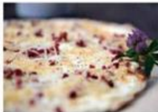
Specialiteten flammkuchen i Ribbeck er værd at køre efter