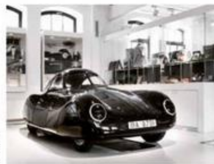
Porsche 64 er en af perlerne i bilmuseet Prototyp i Hamborg

Næste stop er Danmark efter dage i Tyskland, som sender os hjem med krop og sjæl fuld af oplevelser – og masser af godter i bagagerummet. ■