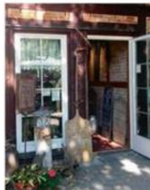
Ribbäckery syner ikke af meget, men maden er god, og du bliver mæt for 55 kr.

re et kvarters gang væk. Tag op til udsigtsplatformen på 8. etage, hvor der er 360-graders udsigt over havn og by. 9.-20. etage er hotellet Westin, og her bor man elegant, skal Motors udsendte hilse og sige. Du kan bo langt billigere i Hamborg, men hvis du er til central beliggenhed, fantastisk arkitektur og de lækreste materialer, er det måske 1.700 kr. pr. nat værd.