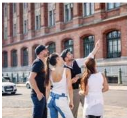
Det gamle røde rådhus i Berlin har spillet en vigtig rolle i byens historie